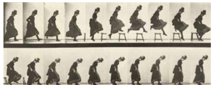
Eadweard J. Muybridge, Woman Jumping, Running Straight High Jump: Plate 156 from Animal Locomotion (1887), 1884–86