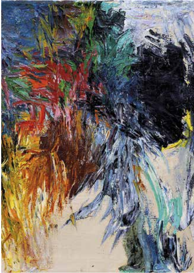
Günther C. Kirchberger, ohne Titel , 1959, Öl auf Leinwand, 62 x 76 cm (Ausschnitt)