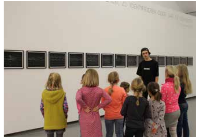
Malzeit, Kunsthalle Göppingen, 2019