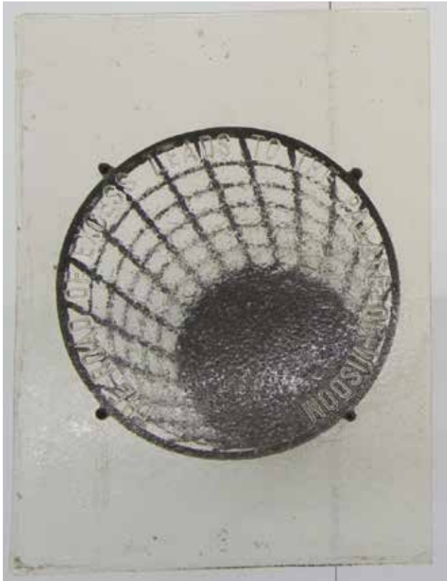
Jaume Plensa, The road of excess leads to the palace of wisdom, 1995 Kunstharz, Eisen, 98 x 71 x 50 cm, Sammlung Kunsthalle Göppingen