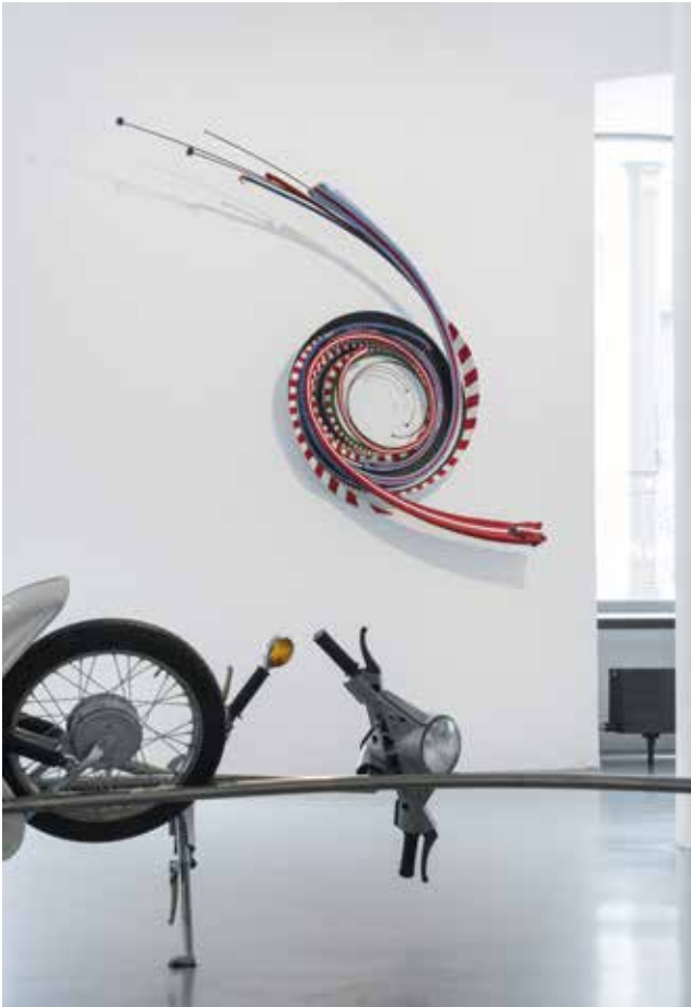
Stefan Rohrer, Le Mans 3 , 2017, Modellautos und Figuren, Stahl, lack, 235 x 140 x 32 cm

In den raumgreifenden Skulpturen des Bildhauers Stefan Rohrer steht die Faszination für das Automobil, für seine Formen und Oberflächen im Mittelpunkt. Freude und Lust an der Geschwindigkeit sind in der Betrachtung seiner Werke nachzuvollziehen. So ist das Auto seit jeher mit Emotionen verbunden – es ist nicht nur Gebrauchsgegenstand sondern mit Vorstellungen und Wünschen besetzt. Aus alten Autokarosserien, Motorrollern und Modellautos formt Stefan Rohrer seine Skulpturen. Karosserien werden zerlegt, gedehnt, geschlungen und neu zusammengesetzt. Zugleich erzählen seine Arbeiten Geschichten – von der Sehnsucht nach Freiheit, aber auch vom Rausch der Geschwindigkeit, von Übermut und Gefahr. Die Titel „Schleudertrauma“ oder „Roller Coaster“ lassen an ein fatales Ende denken. Das Moment des Absurden und des Humors überwiegt jedoch, wie auch in Stefan Rohrers filmischen Arbeiten, die oft das Scheitern zum Thema haben. Die Ausstellung zeigt raumgreifende Skulpturen und Wandobjekte von Stefan Rohrer. Neben seinen Videoarbeiten werden auch großformatige Zeichnungen mit Altöl und Bleistift auf Papier zu sehen sein. Stefan Rohrer wurde 1968 in Göppingen geboren und studierte an der Kunsthochschule Burg Giebichenstein, Halle (Saale), sowie an der Staatlichen Akademie der Bildenden Künste, Stuttgart.