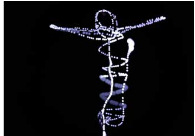
Schülerergebnisse, Kunsthalle Göppingen, 2019