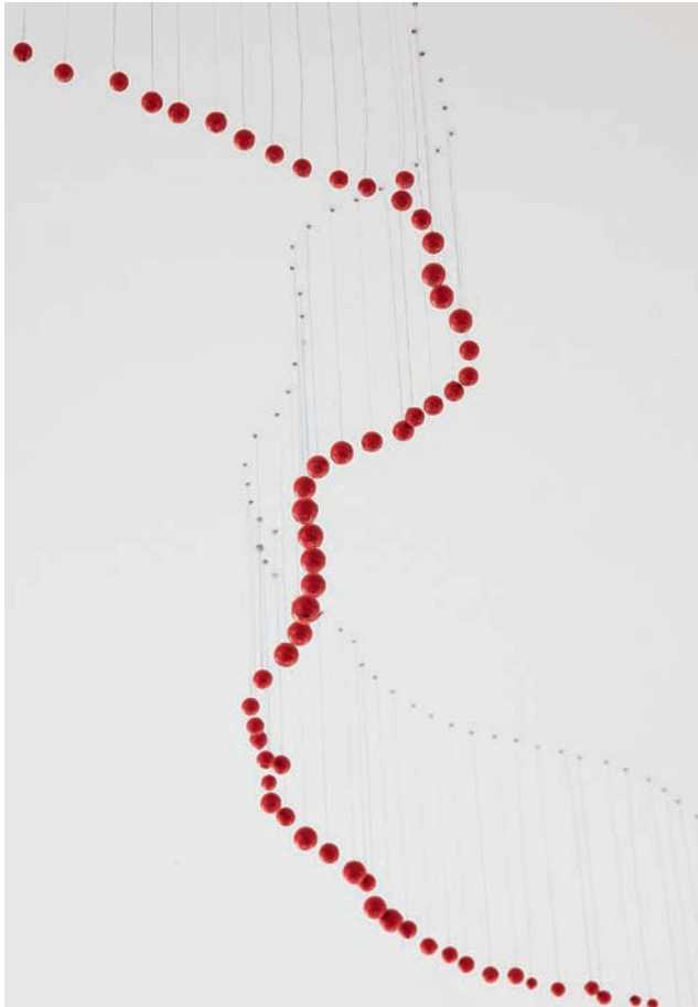
Katharina Hinsberg, Installation Kunsthalle Göppingen, 2019