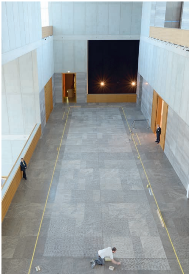
Bastian Muhr, Ohne Titel , 2018 Ortsspezifische Zeichnung im Museum der Bildenden Künste Leipzig 32m x 5,80m, Kreide auf Steinboden, Foto: Björn Siebert, Leipzig