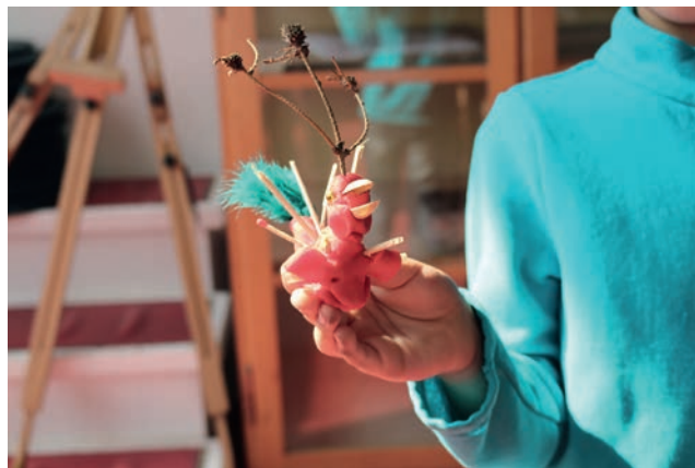
Impressionen: Sommerferienprogramm/Kindergeburtstag zur Ausstellung Böhler&Orendt, The Carrion Cheer. A Faunistic Tragedy , Kunsthalle Göppingen, 2018