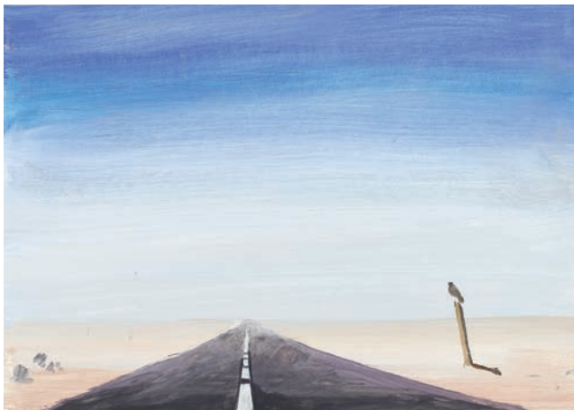
Dieter Schumacher, Straße durch Wüste II , 2017 Gouache auf Papier, 24 x 34 cm