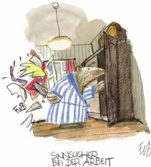
F.W. Bernstein, Sinnsucher bei der Arbeit , (Jahr?) Mischtechnik auf Papier, 50 x 40 cm