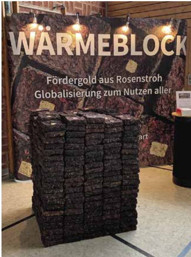
Wärmeblock V, Ausstellungsansicht