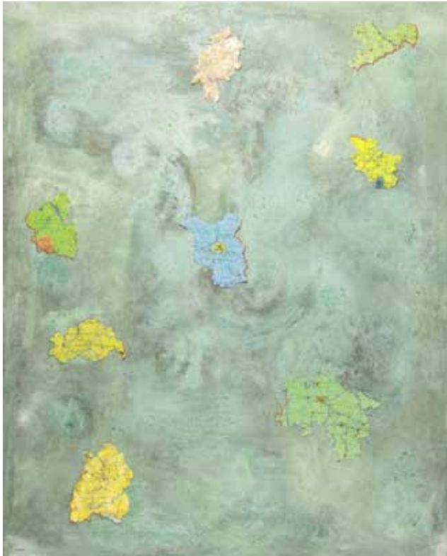
Cristina Barroso, Dried Ocean , 1994 Collage/Öl auf Leinwand und Landkartenausschnitte, 150 x 120 x 15 cm