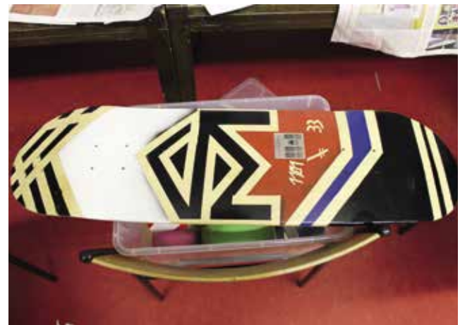
Das ARTPARTMENT im Atelier der Kunsthalle Göppingen, 2018