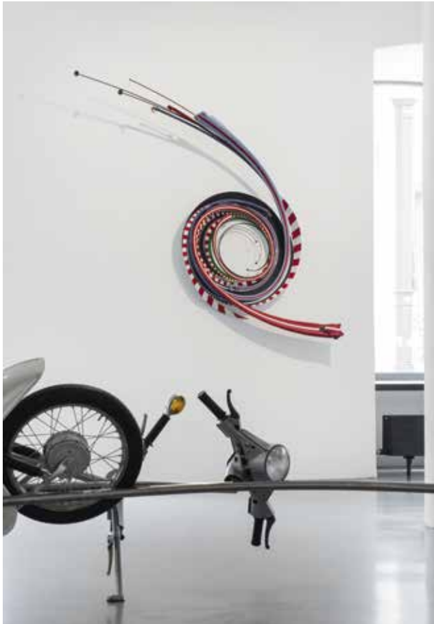
Stefan Rohrer, Le Mans 3 , 2017 Modellautos und Figuren, Stahl, Lack, 235 x 140 x 32 cm