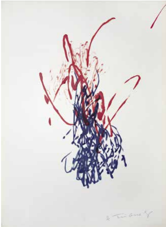
Jean Tinguely, Originalzeichnung, ausgeführt in Zusammenarbeit mit »Méta-Matic Nr. 7« (1959) durch: Museum Haus Lange, Datum: 23. Oktober 1960 31,7 × 23,3 cm Kunsthalle Göppingen