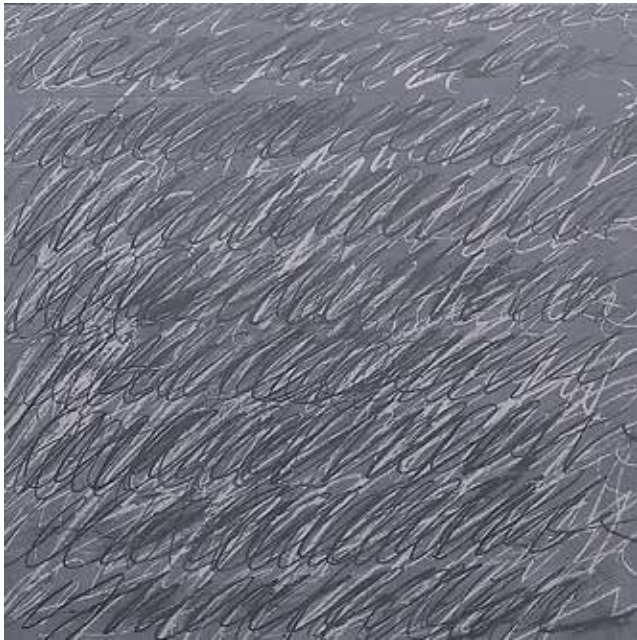
Cy Twombly, aus Portfolio On the Bowery , 1969–1971, Serigraphie, 65 x 65 cm Galerie + Edition Domberger, Filderstadt