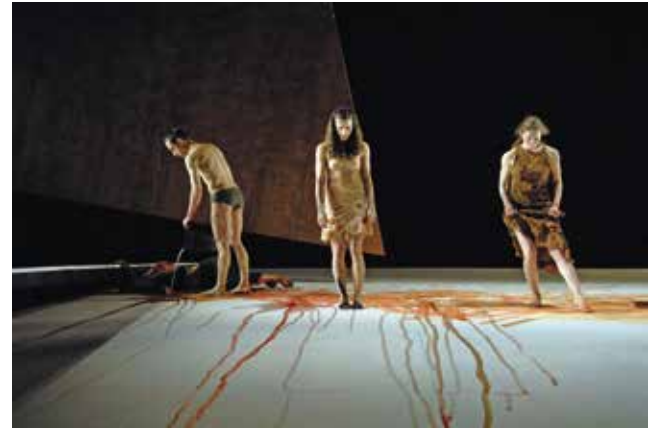
Impromptus von Sasha Waltz, 2015