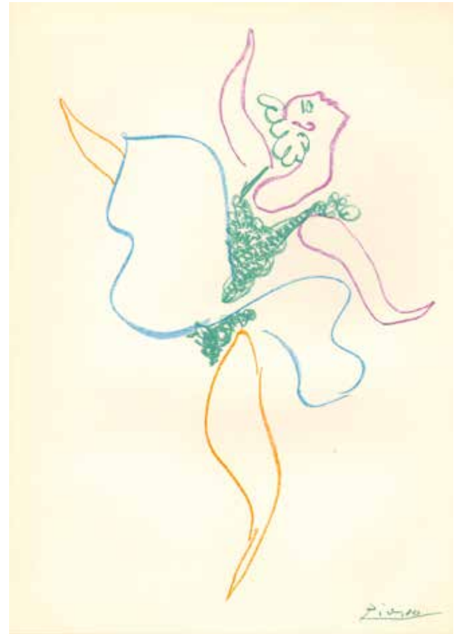
Pablo Picasso, Danseuse , Frontispiz zu Boris Kochno, „Le ballet“, 1954, Farblithografie, © Succession Picasso / VG Bild-Kunst, Bonn 2017, Foto: Flo Fetzter

Neben einer Vielzahl an Führungen wird es zu der Ausstellung „Pablo Picasso und die Literatur“ auch Lesungen und Vorträge geben, so dass die Besucherinnen und Besucher ihr Wissen über den Künstler und seine literarischen Bezugspunkte in ganz verschiedene Richtungen erweitern können. Außerdem entstand in Zusammenarbeit mit dem SWR 2 und in Kooperation mit dem Werner-Heisenberg-Gymnasium Göppingen ein Audioguide für das junge Publikum.