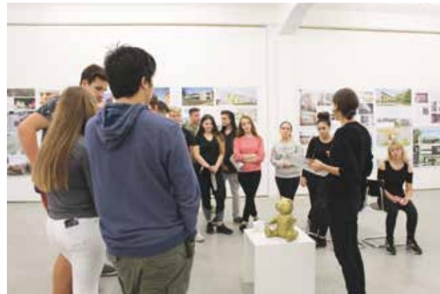
Schüler-Workshop zur Ausstellung Ausgezeichnete Architektur . Hugo-Häring-Landespreis BDA, 2017

Kosten 1 Stunde Führung ohne Praxisteil für bis zu 30 Kinder 40 Euro + 2 Euro Eintritt pro Person