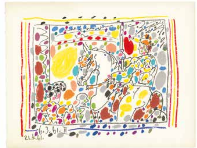
Pablo Picasso, Le picador , aus Jaime Sabartés, „A los toros“, 1961, Farblithografie, 21 x 26 cm, © Succession Picasso / VG Bild-Kunst, Bonn 2017, Foto: Flo Fetzter

Bitte um Voranmeldung unter 07161–650-795 oder kunstvermittlung@goeppingen.de