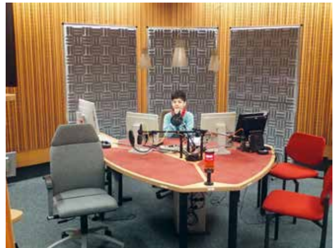
Schüler-Projekt Audioguide Picasso, 2017