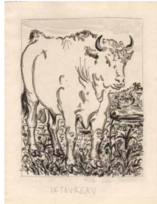
Pablo Picasso, Le taureau , aus Georges Louis Leclerc, „Histoire naturelle“. © Succession Picasso / VG Bild-Kunst, Bonn 2017, Foto: Flo Fetzter

Kosten 1,5 Stunden Führung mit Praxisteil für bis zu 20 Kinder 60 Euro + 2 Euro Eintritt pro Person