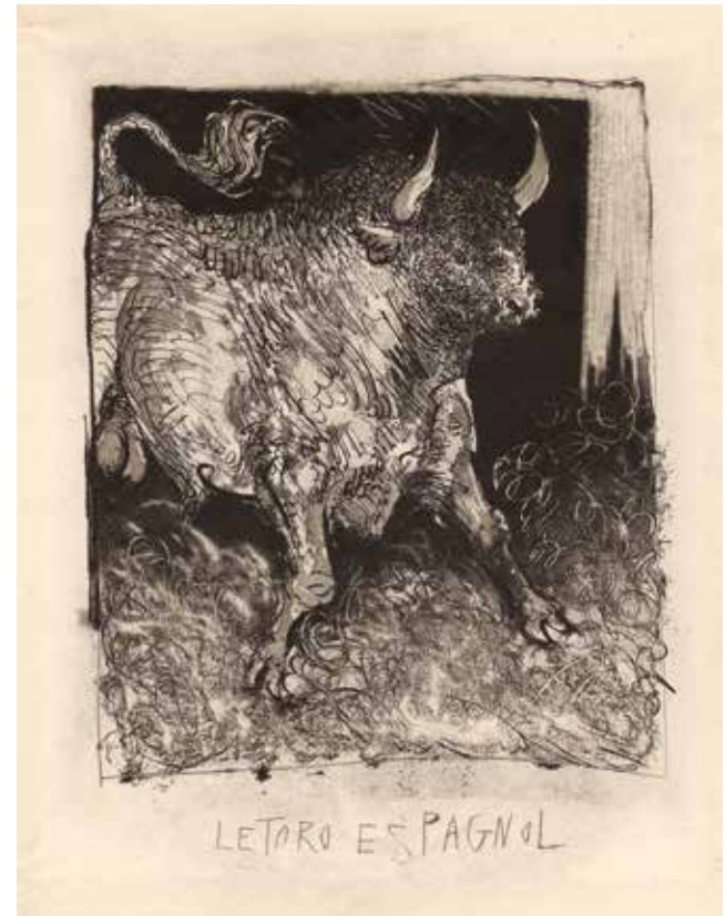
Pablo Picasso, Le toro espagnol , aus: Georges Louis Leclerc, comte de Buffon, „Histoire naturelle“, 1942, Aquatinta / Radierung, 41,5 x 31,5 cm, © Succession Picasso / VG Bild-Kunst, Bonn 2017, Foto: Flo Fetzner

Bitte um Voranmeldung: unter 07161-650-795 oder kunstvermittlung@goeppingen.de