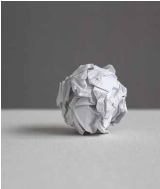
Martin Creed, Work No. 88 , 1995, a sheet of A4 paper crumpled into a ball, 5.1 cm