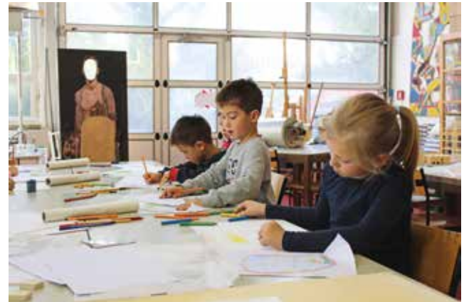
Workshop im Rahmen des Ferien-Specials Ausgezeichnetes Kunsthallenquartier , 2017