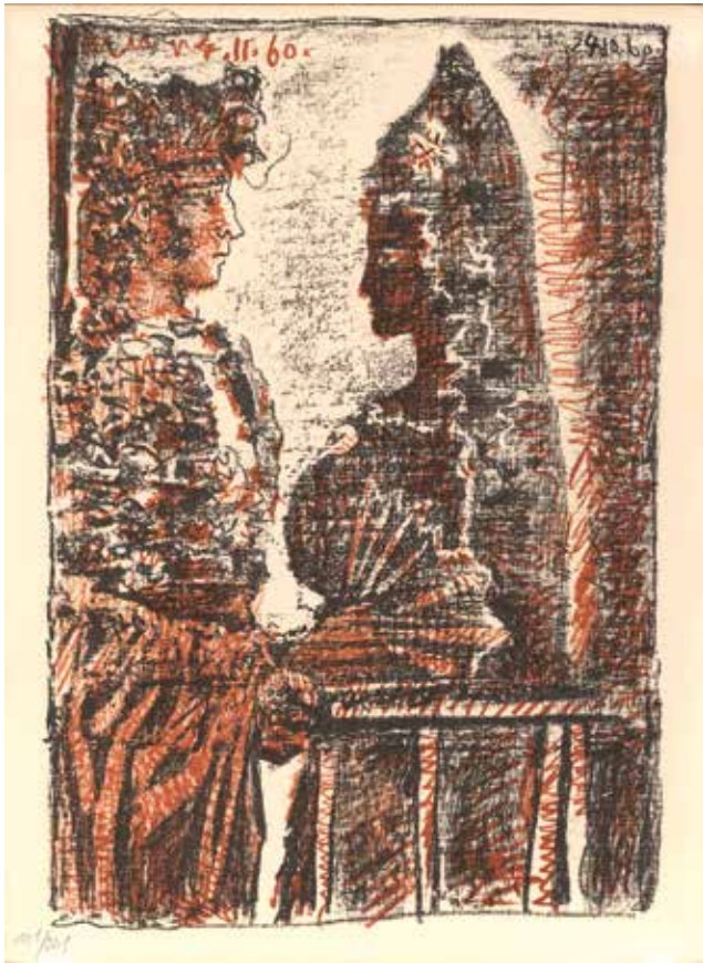
Pablo Picasso, Torero y señorita , aus: Prosper Mérimée / Louis Aragon, „Le Carmen des Carmen“, 1960, Farblithografie, 34,2 x 23 cm, © Succession Picasso / VG Bild-Kunst, Bonn 2017