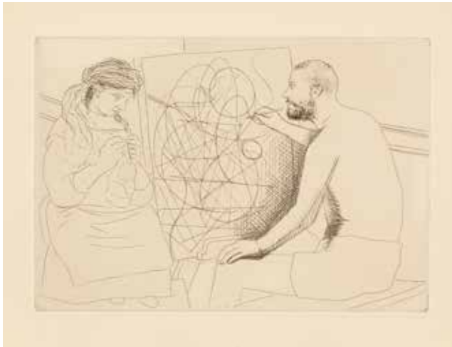
Pablo Picasso, Peintre et modèle tricotant , aus Honoré de Balzac, „Le chef-d'oeuvre inconnu“, 1929, Radierungen, © Succession Picasso / VG Bild-Kunst, Bonn 2017, Fotos: Flo Fetzler

Spannungen zum kulturellen und spekulativen Wert des druckgrafischen Werks Pablo Picassos.