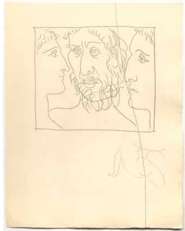
Pablo Picasso, Trois têtes d'hommes, aus Ovid, „Les métamorphoses“, 1931, Radierung, 34,3 x 27,5 cm