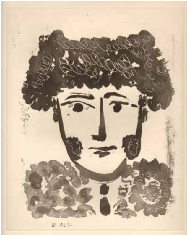
Pablo Picasso, Torero , aus Prosper Mérimée, „Carmen“, 1949, Aquatinta, 31,5 x 25 cm, © Succession Picasso VG Bild-Kunst, Bonn 2017, Foto: Flo Fetzter