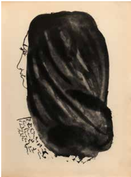
Pablo Picasso, Le poète reproche au soleil de l'avoir obligé à quitter sa dame , aus: Luis de Góngora y Argote, „Vingt poèmes“, 1948, Radierung, © Succession Picasso / VG Bild-Kunst, Bonn 2017

Bitte um Voranmeldung: unter 07161–650-795 oder kunstvermittlung@goeppingen.de